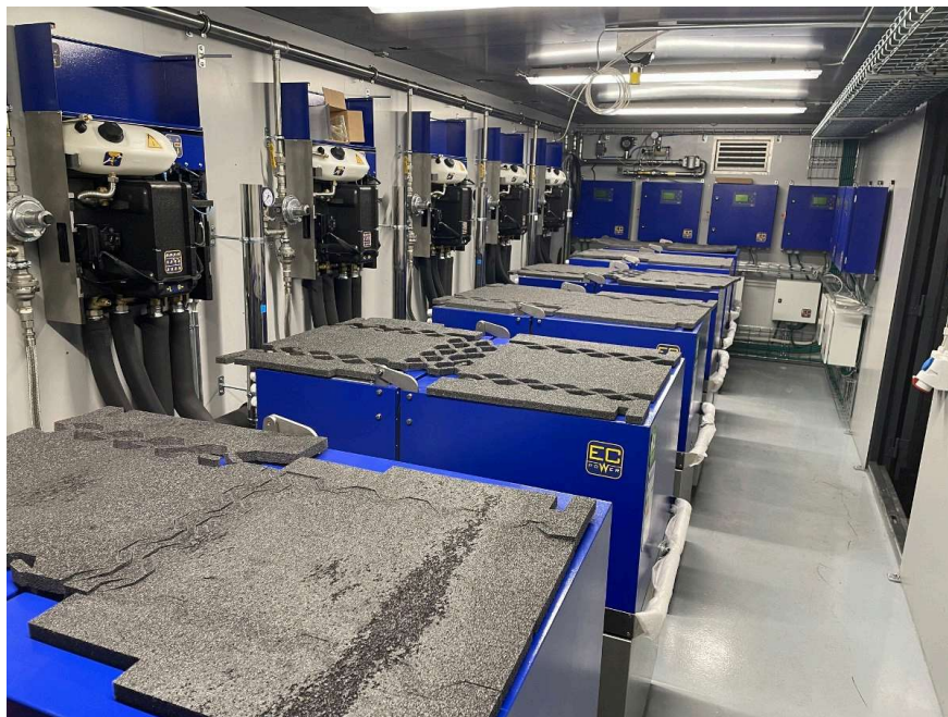
MOTOR: Anlegget på Inderøy har seks motorer.