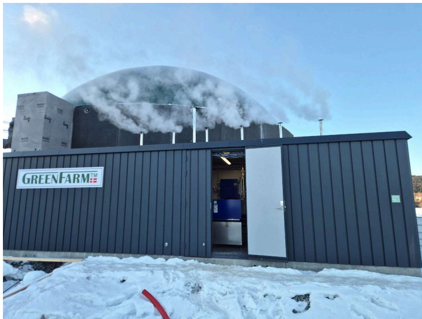
Biogassanlegget på gården til Atle Næss ble nylig satt i drift, og er det største GreenFarm har levert.

GreenFarm har etablert anlegg i Norge, Danmark og Litauen. Deres anlegg kan skaleres fra 3 000 til 20 000 m 3 gjødsel årlig, og kan tilpasses alle husdyrbruk med gjødsel. Hvert anlegg tilpasses den aktuelle gjødselmengden, det lokale energibehovet og bondens fremtidige vekstplaner.